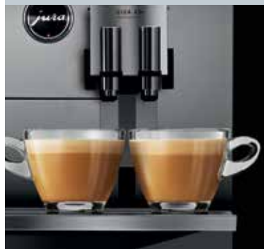
Variabler Kombiauslauf mit 2 Kaffee- und 2 Milchausläufen