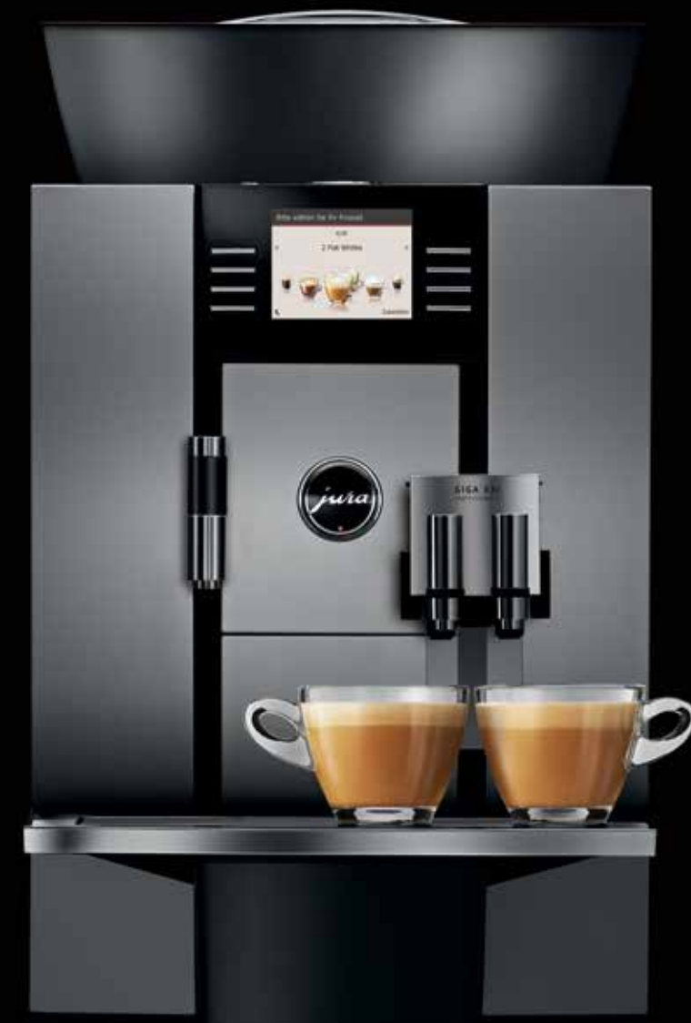
GIGA X3c Professional

Dank einer breiten Palette von Zubehörartikeln wie Tassenwärmer, Milchkühler, Kaffeesatzabwurf-Set und Schnittstelle für Abrechnungssysteme sowie einem attraktiven Möbelsortiment lässt sich für jedes Einsatzgebiet eine optimale, an die individuellen Bedürfnisse angepasste Kaffee-Gesamtlösung zusammenstellen.