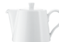
Kaffee im Kännchen (360 ml) 2 Min. 33 Sek.