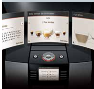
Individuell programmierbarer Start-Bildschirm